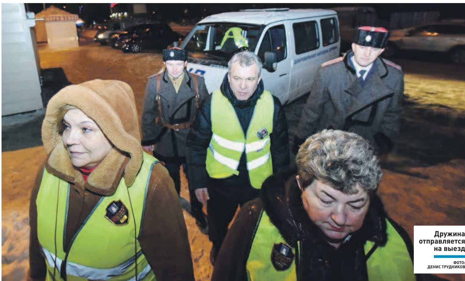
Дружина отправляется на выезд