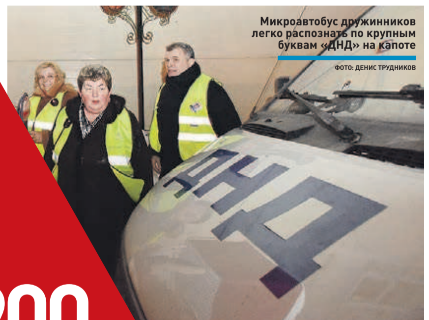
Микроавтобус дружинников легко распознать по крупным буквам «ДНД» на капоте

Доводилось нам в задержании грабителей участвовать: гастролеры полезли грабить магазин, продавщица с ними сцепилась. Мы вовремя подоспели, а следом и полиция.