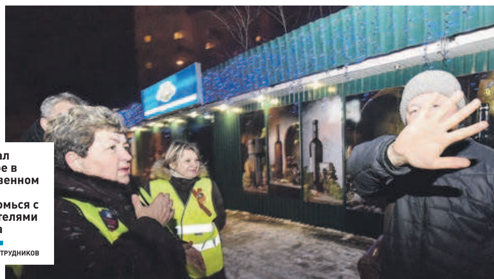
Распивал спиртное в общественном месте? Познакомьтесь с блюстителями порядка