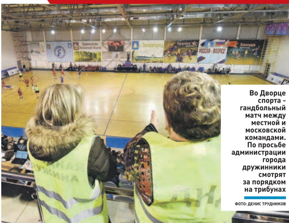
Во Дворце спорта - гандбольный матч между местной и московской командами. По просьбе администрации города дружинники смотрят за порядком на трибунах

В Звенигороде дружинники стоят на страже «сухого закона»