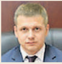
Роман КАРАТАЕВ, министр правительства Московской области по безопасности и противодействию коррупции: