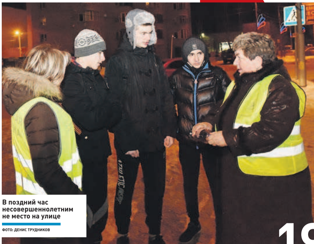
В поздний час несовершеннолетним не место на улице

Народная дружина в Звенигороде девять лет помогает полицейским охранять общественный порядок. Дружинники дежурят во дворах и на улицах каждый день. Вместе с полицией навещают неблагополучные семьи и проводят рейды по выявлению нелегальных мигрантов. А с недавнего времени следят, чтобы в городе не появлялись несанкционированные свалки и вовремя вывозился мусор.